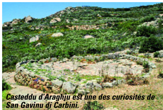
Casteddu d'Araghju est une des curiosités de San Gavinu di Carbini.

Le syndicat d'initiative de Porto Vecchio est devenu, en 2009, l'Office de tourisme de Zonza-Sainte Lucie de Porto Vecchio, afin de parfaire la promotion du territoire. Les informations délivrées au public sont à la fois d'ordre patrimoniale, culturelle, professionnelle, sportive... Des brochures sont éditées et distribuées sur tout le territoire et un site Internet diffuse l'information au niveau international : http://www.sainteluciedeportovecchio.com ).